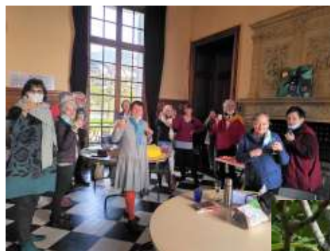
Retrouvailles au château

Dans une grande salle du château, nous revenons en présentiel comme on dit maintenant. Notre bébé est né après 10 mois de gestion, choix des textes, tri des mails, pèle mêle... mise en forme, impression : le journal du confinement est enfin sorti des cartons en 200 exemplaires et nous en sommes très fiers !