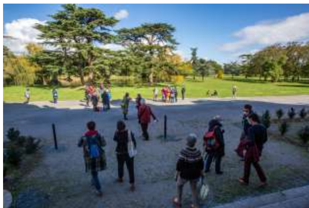
Du soleil et des sourires masqués...