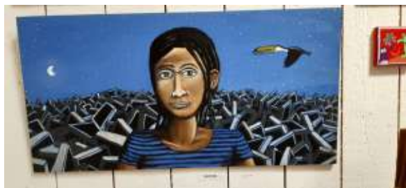
Peinture de sapiens - © Yannis Chauviré