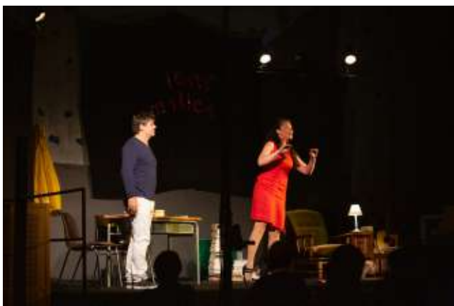
Tant qu'il y aura des coquelicots, compagnie « Hé Psst ! »

La compagnie « Hé Psst » nous a proposé une pièce jubilatoire questionnant la découverte intime de la lecture. Le public en est ressorti émerveillé ! En partenariat avec Scènes de Pays.