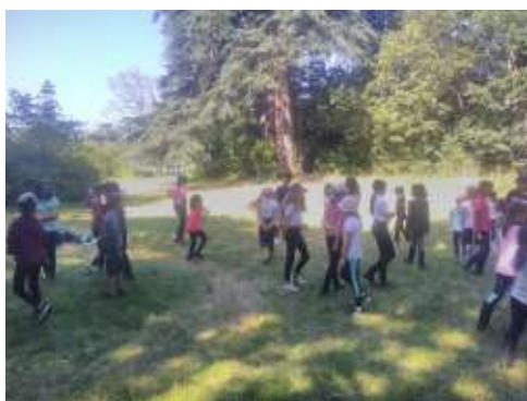
Jeux de théâtre sur l'île de la Turmelière

J'ai proposé l'animation D'une vague à l'autre, pour amener les enfants à écouter la lecture d'un album jeunesse puis faire des jeux de théâtre et enfin se réapproprier l'album la Vague pour en réécrire les dialogues.