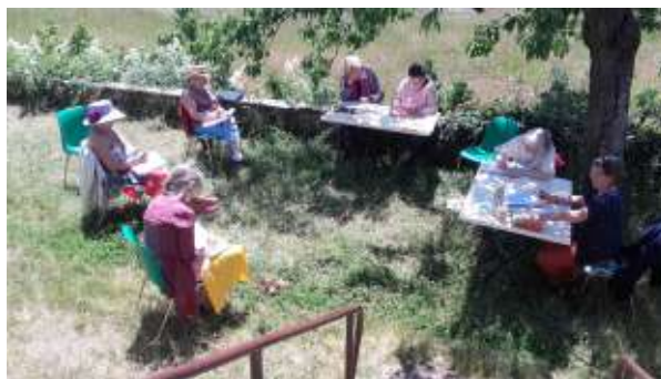
Retrouvailles printanières

Trouver dix mots inconnus dans le dictionnaire et les utiliser sans regarder la définition (Proposé par Yanniss)