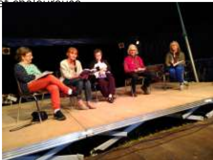
Quelques membres de Terres d'Écritures en présentation sous le chapiteau d'Orée d'Anjou

Cinq lecteurs ont lu quelques extraits du livre Terres d'écritures au temps du confinement leur journal du 17 mars au 11 mai 2020 (haïku, lettre, confinement vu par des animaux...) devant une vingtaine de spectateurs. Ensuite, ils ont répondu aux questions des participants, le tout dans une ambiance d'écoute conviviale et chaleureuse.