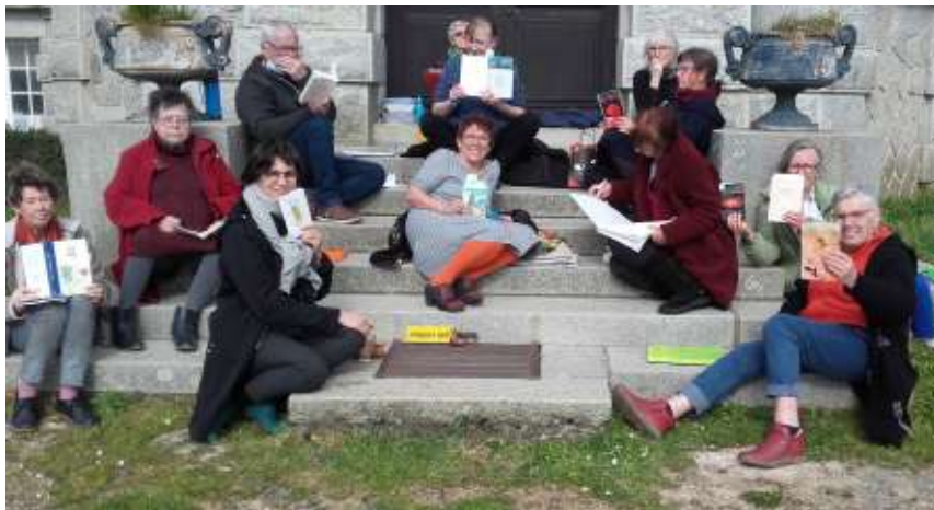
Le groupe Terres d'Écritures sur les marches du château