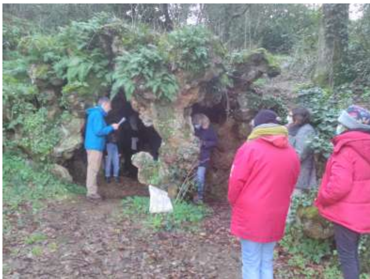
Lecture venteuse dans la grotte de la Turmelière

Antoine Barbedet, médiateur du livre de la Turmelière