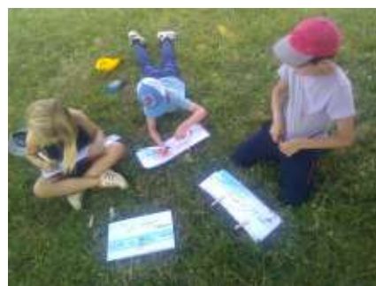
Réécriture d'album par les enfants

De belles créations autour de la petite fille et de la vague !