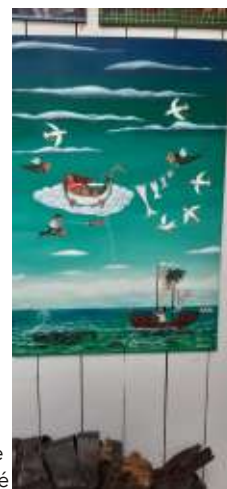
Peinture de Dominique Eustase