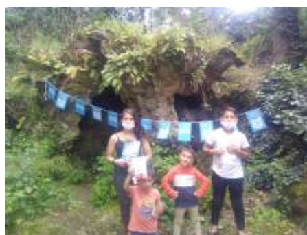
Une famille à la découverte de son lieu de vie !

L'été a commencé par une belle animation avec une famille hébergée par l'association « Une famille, un Toit » à la Turmelière. Visite du château, lectures dans la grotte et balade contée, nous avons enfin eu l'occasion de nous rencontrer à travers cette médiation littéraire ! Chaque personne est repartie un livre sous le bras et pour les plus grands avec un chèque lecture offert par le Centre National du Livre.