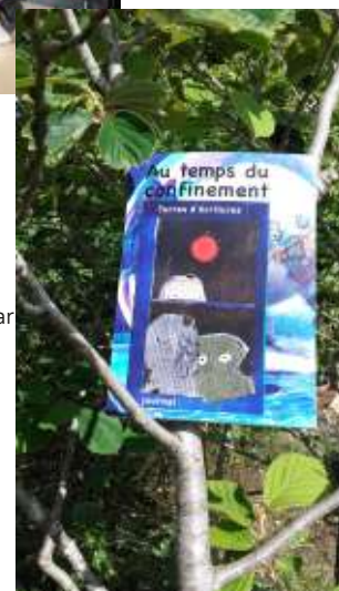
Journal du confinement, auto édité par Terres d'Écritures !