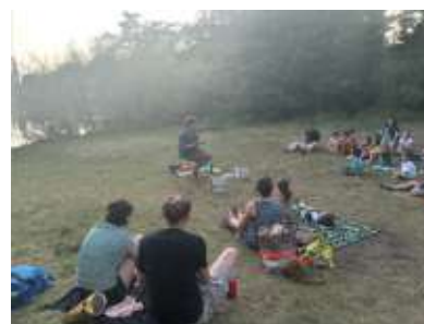
Soirée contes sur l'île de la Turmelière

Deux jeudis soirs où Antoine Barbedet a proposé deux soirées contes à destination des petits et des grands, alternant lectures d'albums, légendes bretonnes et histoires de la Turmelière. Une belle réussite, au dire des participants !